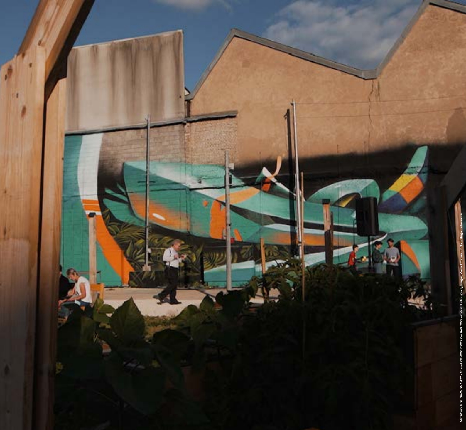
MÉTROPOLÉ DU GRAND NANCY - N° sereiz 245406760012 - www.2022